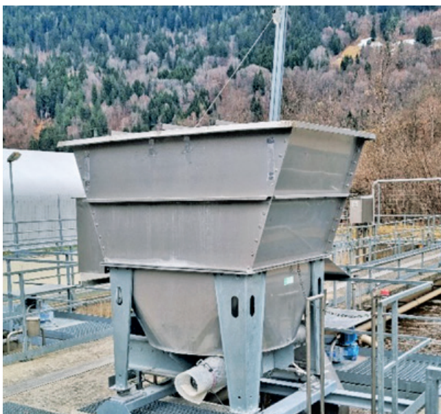
La maschina da dosascha da rida en siu niev liug.